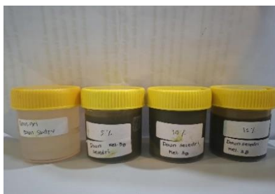
Gambar 1. Gambar Hasil Sediaan Gel

Hasil yang diperoleh dari pembuatan gel menggunakan ekstrak daun seledri pada formulasi F0 menunjukkan tidak adanya ekstrak daun seledri. Formulasi F1 mengandung 5% ekstrak daun seledri, F2 mengandung 10% ekstrak daun seledri, dan F3 mengandung 15% ekstrak daun seledri. Setiap formulasi menunjukkan aroma, warna, dan konsistensi yang karakteristik dari daun seledri (Vera Estefania Kaban et al., 2024).