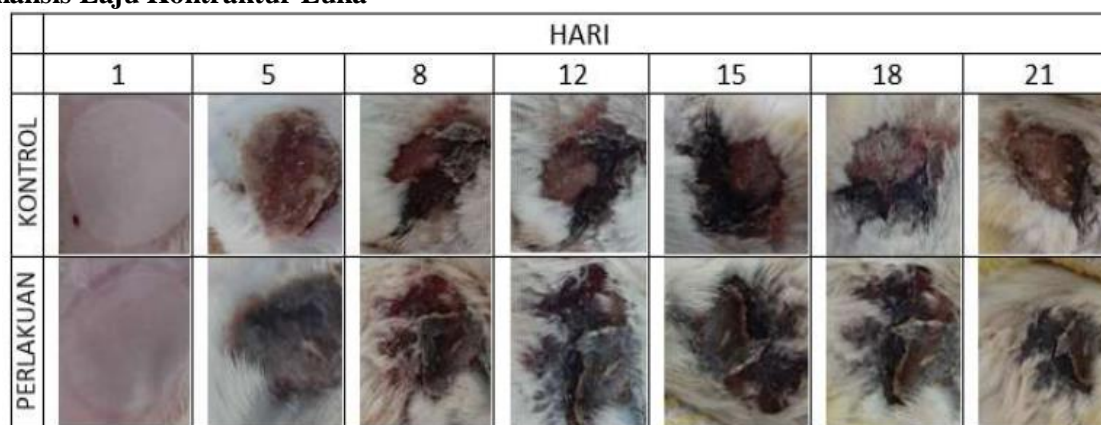
Gambar 3. Pengamatan Makroskopik Lesi Luka Bakar Selama 21 Hari

Data menunjukkan bahwa luas luka bakar pada kelompok kontrol dan kelompok perlakuan berkontraksi dan mengecil selama 21 hari pengamatan. Hal ini sesuai dengan teori proses penyembuhan luka yang terbagi menjadi 3 fase yaitu inflamasi, proliferasi dan remodeling. Fase inflamasi biasanya terjadi dalam 24-48 jam pertama [18]. Fase proliferasi meliputi angiogenesis, fibroplasia dan reepithelialisaton, yang terjadi dalam 2-14 hari ke depan [19]. Terakhir, fase remodeling terjadi 2-3 minggu hingga 1 tahun atau lebih, di mana luka mulai berkontraksi [21]. Namun, tidak ada perbedaan signifikan yang ditemukan antara area luka bakar pada kelompok kontrol dan kelompok perlakuan dalam semua hari selama 21 hari. Ini mungkin karena dosis yang digunakan tidak optimal untuk menghasilkan hasil yang signifikan. Dosis Ashitaba yang digunakan hanya berdasarkan penelitian sebelumnya yang tidak spesifik untuk kasus luka bakar [11]. Berbagai dosis diperlukan dalam percobaan masa depan untuk memastikan apakah hasil yang signifikan dapat diperoleh.