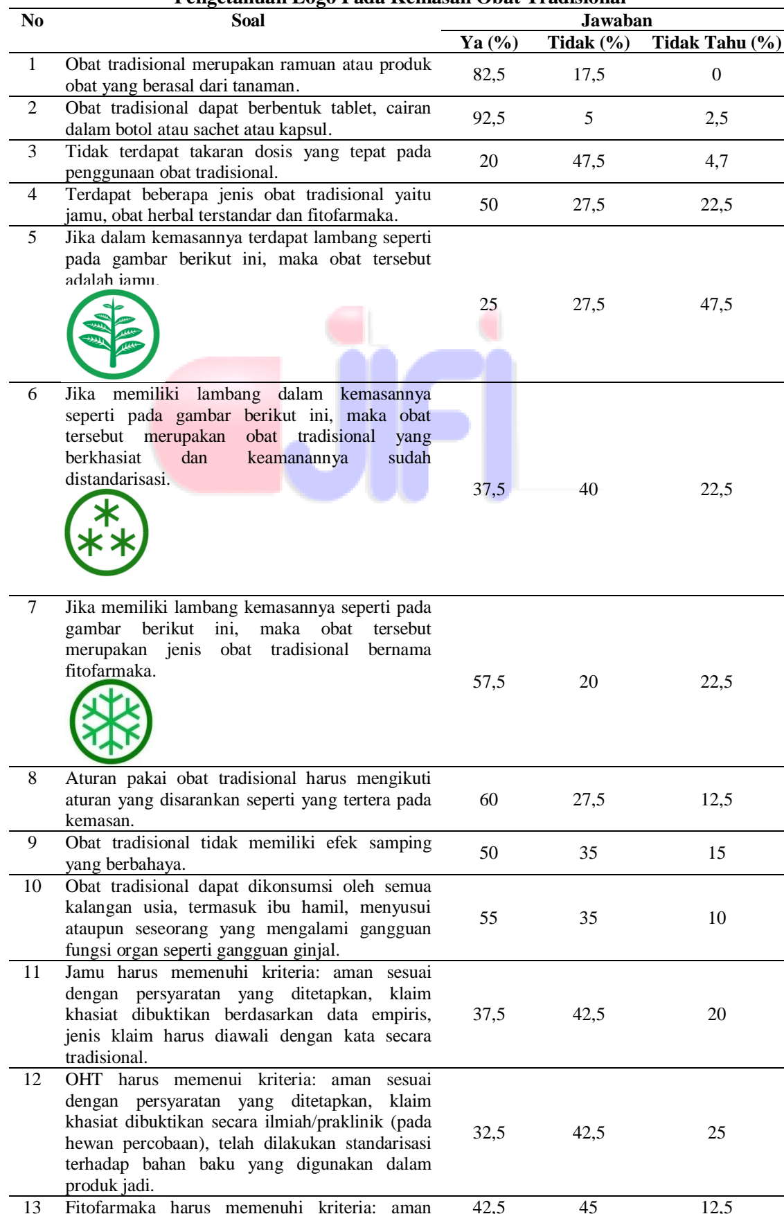
Tabel 2. Distribusi Jawaban Mahasiswa Terhadap Kuesioner Bagian Dua Tentang Tingkat Pengetahuan Logo Pada Kemasan Obat Tradisional